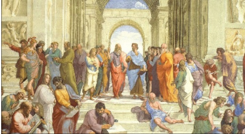
De Atheense school [Raphael plm. 1510]. De hemelse Plato wijst naar de hemel en de pragmatische Aristoteles wijst naar de aarde.