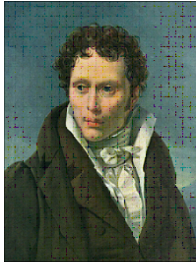
Arthur Schopenhauer, 27 jaar (1815)

"Trouwen houdt de halvering van je rechten in en een verdubbeling van je plichten", aldus Arthur Schopenhauer (1788-1860). Ook, "Trouwen betekent geblinddoekt grijpen in een teil in de hoop een aal te pakken te krijgen tussen de slangen". Zijn moeder deelde hem mee dat zijn eerste boek, Über die vierfache Wurzel des Satzes vom zureichenden Grunde (1813), onleesbaar was en dat zij het zich niet kon voorstellen dat iemand het zou willen kopen. In woede ontstoken beet hij terug dat zijn boek gelezen zou blijven, lang nadat de "rotzooi" die zij schreef totaal was vergeten 1) . Uit de