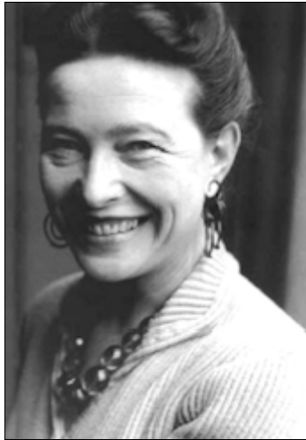
Simone de Beauvoir