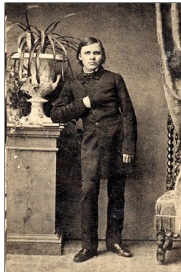
Friedrich Wilhelm Nietzsche (1844-1900) in 1861

Iemand die op de sterfdag van Napoleon Bonaparte 1) het levenslicht zag, was een jong volwassene toen Nietzsche werd geboren 2) . Een negentiende-eeuwer die in de tijd dicht bij de Napoleontische periode stond, is Nietzsche vooral van invloed geweest op het denken in de twintigste eeuw. In wat voor een wereld leefde een negentiende-eeuwer? Hoewel de aanzetten voor de moderne tijd sinds de Franse Revolutie zichtbaar waren, is de negentiende eeuw ook de eeuw van Restauratie, gekenschetst door een terugverlangen, van de heersende klasse, naar de gezagsverhoudingen en machtspositie van voor de Franse Revolutie. Een vruchteloos verlangen, want samen met een doorzettende Industriële Revolutie kreeg de arbeidende klasse een steeds duidelijker stem. Het is de tijd van Karl Marx en Friedrich Engels, de eerste vakbonden. Tot in de achttiende eeuw werd in Europa de dienst uitgemaakt door een heersende klasse van adel en geestelijkheid, het Ancien Regime, de