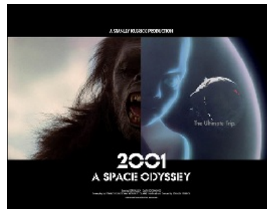
Halverwege aap en übermensch?

Als men zich wil laven aan de wijsheid van anderen, hun invloed wil ondergaan, bedenk dan altijd dat het een wijsheid was die gold voor de mensen in de tijd waarin de uitspraak werd gedaan. Dat impliceert tegelijk dat men nooit de wijsheid van anderen als leidraad voor het eigen leven kan nemen. Men kan op een gedachte worden gebracht, maar dat is het maximale. De uiteindelijke wijsheid ligt nooit buiten jezelf, maar in jezelf. De mooiste illustratie daarvan is de parabel van de talenten. Jezus heeft geen enkele uitspraak gedaan met het oog op een aantal industriëlen uit de negentiende eeuw. Deze industriëlen zijn daarentegen aan de haal gegaan met een Bijbelse uitspraak die hen wel goed uitkwam, ervan uitgaand dat een parabel uit de Bijbel toch wel de