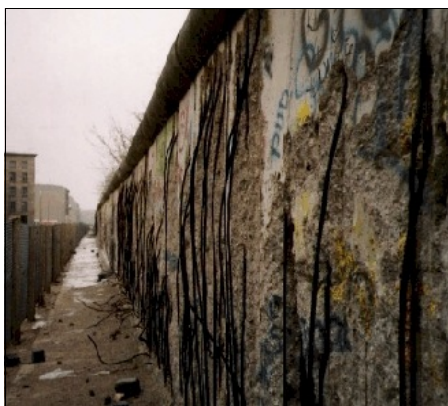
De muur in je hoofd

Stel jezelf in alle oprechtheid de vraag, waar loop ik steeds tegen aan, wat is het onvolmaakte in mij? Waarom heb ik mijzelf nog niet lief? Waar staan de muren, waar liggen de blokkades in jezelf, die tot nu toe voorkomen hebben, dat je het geluk bereikte waar je naar hongert. Ga eveneens na wat in je huidige leven die momenten zijn geweest, waarin je niet anders kon of wilde dan een