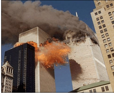
De onverhoedse 'plundering' van New York

atoombommen gooit om 'vrede' af te dwingen, de jihadist die zich uit wraak in een wolkenkrabber boort. De wijze die je dwingt de andere wang toe te keren, de zieke geest die je daarna tegen de grond mept. De leraar -die deze eretitel niet waar maakt- die je strafwerk geeft voor een geestige opmerking, je buurman die zich niet realiseert dat jij alleen de bonkende bassen van zijn muziek hoort.