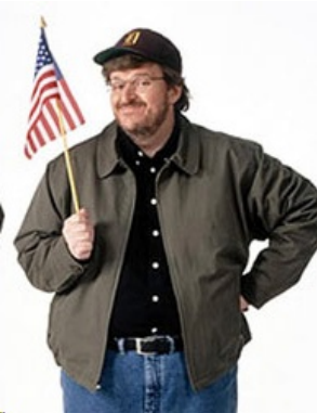
Michael Moore, Bowling for Columbine

niet te vertrouwen, ziek eigenlijk. Dit alles maakt Amerika en de Amerikanen echter niet tot de Grote Satan zelve, maar eerder tot het slachtoffer van de Grote Satan, of preciezer, tot de onderdaan van Lucifer, de onderdaan van het Luciwher paradigma 14 ). Gezien al het bovenstaande, ondanks of dankzij alle irritaties en hun eigenaardigheden, zijn Amerikanen beter te karakteriseren als echte mensen, waarachtige mensen. Het was Tru-man, de ware mens, die de bom gooide op Hiroshima en Nagasaki. Amerika als dader en als slachtoffer, het verhaal van de mens. De triestheid en de heroïek van mensen die desperaat op zoek zijn naar een beetje liefde, een beetje medemenselijkheid, een beetje warmte bij elkaar. Mensen die daarbij tevens in een geweldsspiraal gevangen zitten en die dat kleine beetje van de grond geschraapte liefde -à la Hollywood- en dat kleine beetje medemenselijke warmte bereid zijn te verdedigen met geweld en ondergaan geweld altijd zullen willen wreken -en dat gerechtigheid noemen-. Zo triest, zo ziek.