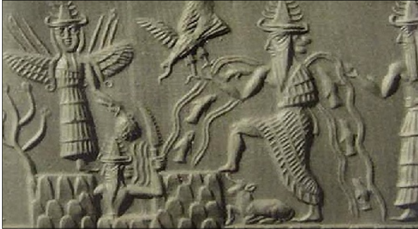
Enki 4) de Grote Satan en God van de Afgrond, 2 e millennium vce, Mesopotamië