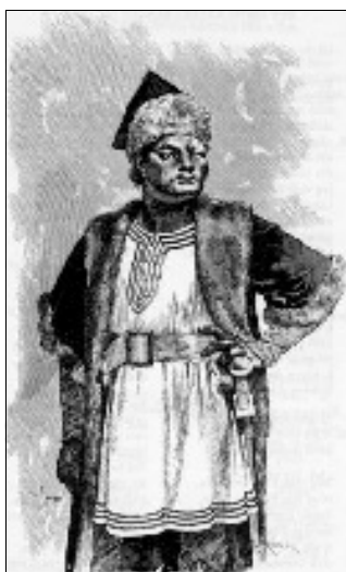
Atilla de Hun

"Tegen het midden van de vijfde eeuw trokken allerlei volkeren door Europa – het Romeins centraal gezag was te verzwakt of zelfs afwezig om deze groepen tegen te houden. De Goten trokken vanuit Scandinavië naar het gebied bij de Zwarte Zee. Een deel van die Goten trok langs de hele Middellandse Zeekust om uiteindelijk in zuidwest Frankrijk en in Spanje rust te vinden. Longobarden trokken vanuit centraal Duitsland naar het noorden van Italië waar zij hun naam gaven aan de streek Lombardije. De Vandalen trokken ook vanuit centraal Duitsland dwars door Frankrijk en Spanje naar het noordelijk deel van Afrika, de Maghreb, om van daaruit weer over te steken naar Sicilië en Sardinië en uiteindelijk naar het Italiaanse vasteland. Angelen en Saksen staken de Noordzee over om de vertrokken Romeinen op de Britse eilanden op te volgen. De Germaanse stam de Franken nam het continentale Gallo-Romaanse gebied over en gaf Frankrijk zijn huidige naam. Een invasie dus, zoals je ziet, van Germaanse stammen in