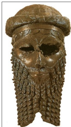
Šarru-kinu, Sargon van Akkad

"De digitale revolutie," zei Manas toen hij weer was gaan zitten. Hij sprak de woorden net niet schamper uit. "De tekenen zijn duidelijk. De centrale macht in de westerse wereld zal de polarisatie tussen het westerse en het oosterse aangrijpen om de schier oncontroleerbare vrijheid van zijn eigen burgers te onderdrukken. De digitale revolutie wordt ten grave gedragen, want het relatief anarchisme van die vrijheid is de centrale macht een doorn in het oog. Het is een oeroude truc wanneer de eigen bevolking onder de duim moet worden gehouden - creëer een gevaar dat van buitenaf komt. Šarru-kinu of Sargon de Grote van Akkad 8) paste die truc al toe in 2334 bce. Sargon wordt beschouwd als de allereerste imperialistische veroveraar in de geschiedenis van de mensheid. Over Sargon bestaat trouwens nog een interessante anekdote. Over hem wordt verteld dat hij geadopteerd is, een vondeling die in een rieten mandje op de rivier de Eufraat dreef en die uiteindelijk de lieveling werd van de godin Ishtar. Komt dat je ergens bekend van voor?" Ik antwoordde dat dit verhaal me natuurlijk bekend was. Ik herkende hetzelfde verhaalmotief dat gebruikt is om de afkomst te illustreren van de profeet Musa, ook Mozes genaamd - Mosje in het Hebreeuws.