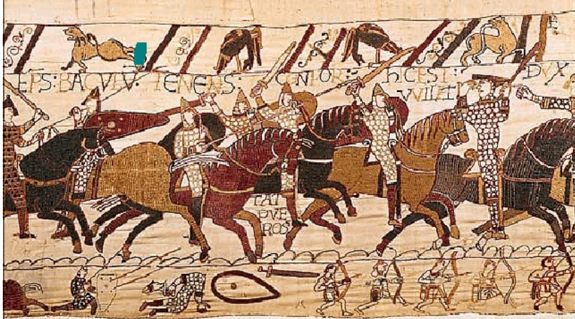
Willem de Veroveraar, weergegeven op het Tapijt van Bayeux

moment heet hij Willem de Veroveraar 21) en hij weet uiteindelijk ook de Danelaw onder zijn bewind te krijgen - de basis van het huidige Verenigd