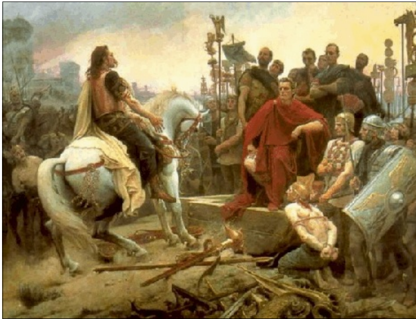
Vercingetorix (te paard) en Caesar

"Welke les moeten we nu trekken uit al deze geschiedenissen? Wat mij betreft, dat het in deze wereld niet veilig is en dat je de verworvenheden die je graag wilt behouden ook zal moeten verdedigen. In die strijd is degene met de meest dominante organisatievorm in het voordeel boven hen die zich niet centraal organiseren. Vercingetorix probeerde de weerstand tegen Caesar wel te organiseren, maar het