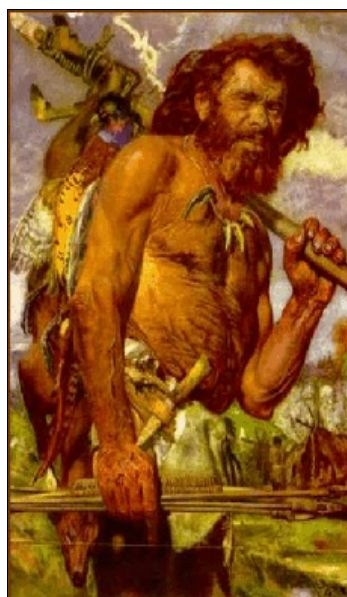
Cro Magnon mens

introkken die bewoonbaar werden nadat het ijs zich naar het noorden terugtrok, nu zo'n twaalf duizend jaar geleden. De stammen die wij tezamen Kelten noemen, daar concentreer ik me nu even op, kwamen terecht in de Balkan, het Alpengebied, Frankrijk, in het noordwesten Spanje en in Portugal, in Engeland, Schotland en in Ierland. Duizenden jaren hebben deze mensen in Europa in een verband geleefd zonder een centrale regering of een andere vorm van overkoepelend gezag, maar wel met een cultuur die hen samenbond. Je kunt de structuur van de Keltische cultuur nog het best vergelijken met het internet, maar dan met de snelheid van de bronstijd. De verste plekken in het gebied stonden met elkaar in verband via een gedecentraliseerd netwerk van wegen met lokale stedelijke knooppunten."