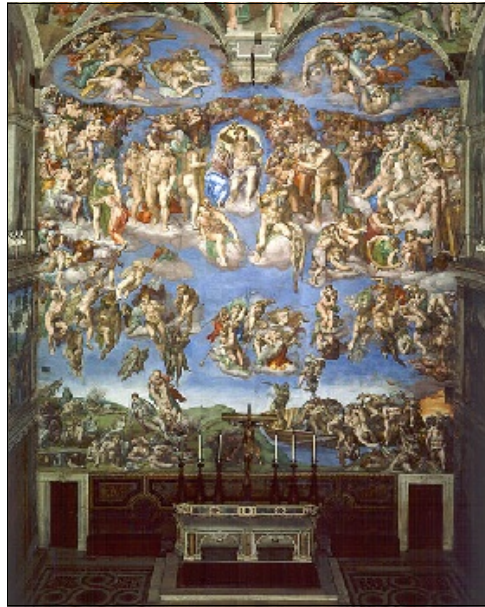
Het laatste oordeel

Manas zei eens dat ons leven, in onze originele staat en in deze droomvorm -ik vind dat poëtischer klinken dan incarnatie- loopt van het zoeken naar het antwoord op de vraag naar het wat en daarna naar de vraag naar het hoe. Een antwoord op de vraag naar het waarom zullen wij in deze vergankelijke wereld nooit vinden. Wie denkt dat